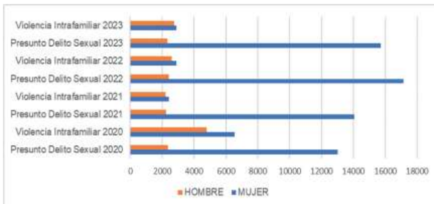
Figura 7.1 Comparativo entre los presuntos delitos sexuales y la violencia intrafamiliar, 2020-2023

Fuente: elaboración propia con base en el Instituto Nacional de Medicina Legal y Ciencias Forenses (2023).